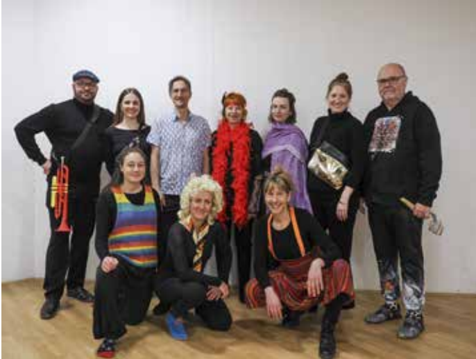
DAS ENSEMBLE KANN SICH SCHON SEHEN LASSEN!

Am 6. März startet das Pfarrmusical GODSPELL in der Kirche Glanzing