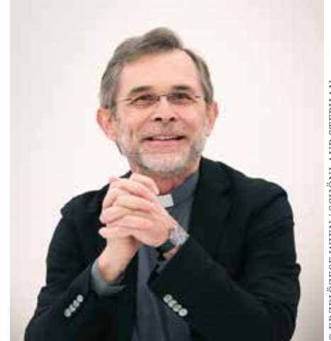
ERZBISCHOF JOSEF GRÜNWIDL

Wenn es um das Thema Armut und Migration geht, ist die Kirche gefragt. Aus der jüdisch-christlichen Tradition der Bibel haben die Fremden, die Obdachlosen und Hilfsbedürftigen einen ganz hohen Stellenwert, weil uns in diesen Menschen Gott selber begegnet, so hat es Jesus gesagt: Ich war fremd und ihr habt mich aufgenommen, ich war obdachlos und ihr habt euch um mich gekümmert.