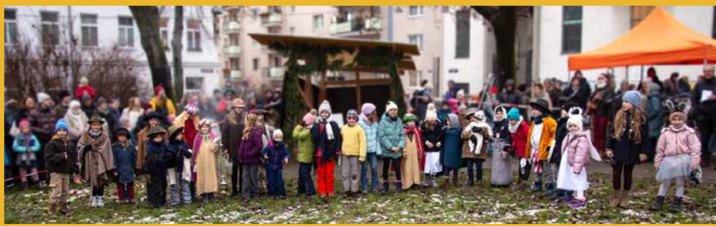
KRIPPENSPIEL DER JUNGSCHAR 2025

Die Jungschar räumt auf und blickt voraus