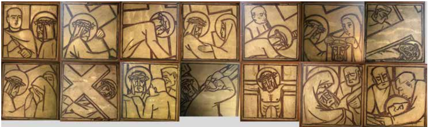
DIE 14 STATIONEN DES ALTEN KREUZWEGES IN DER KRIM VON FRANZ ERNTL

Interessante Details zur Entstehung und Ausführung jener Kreuzwegbilder, die nun auf der Chorempore hinter der Orgel hängen