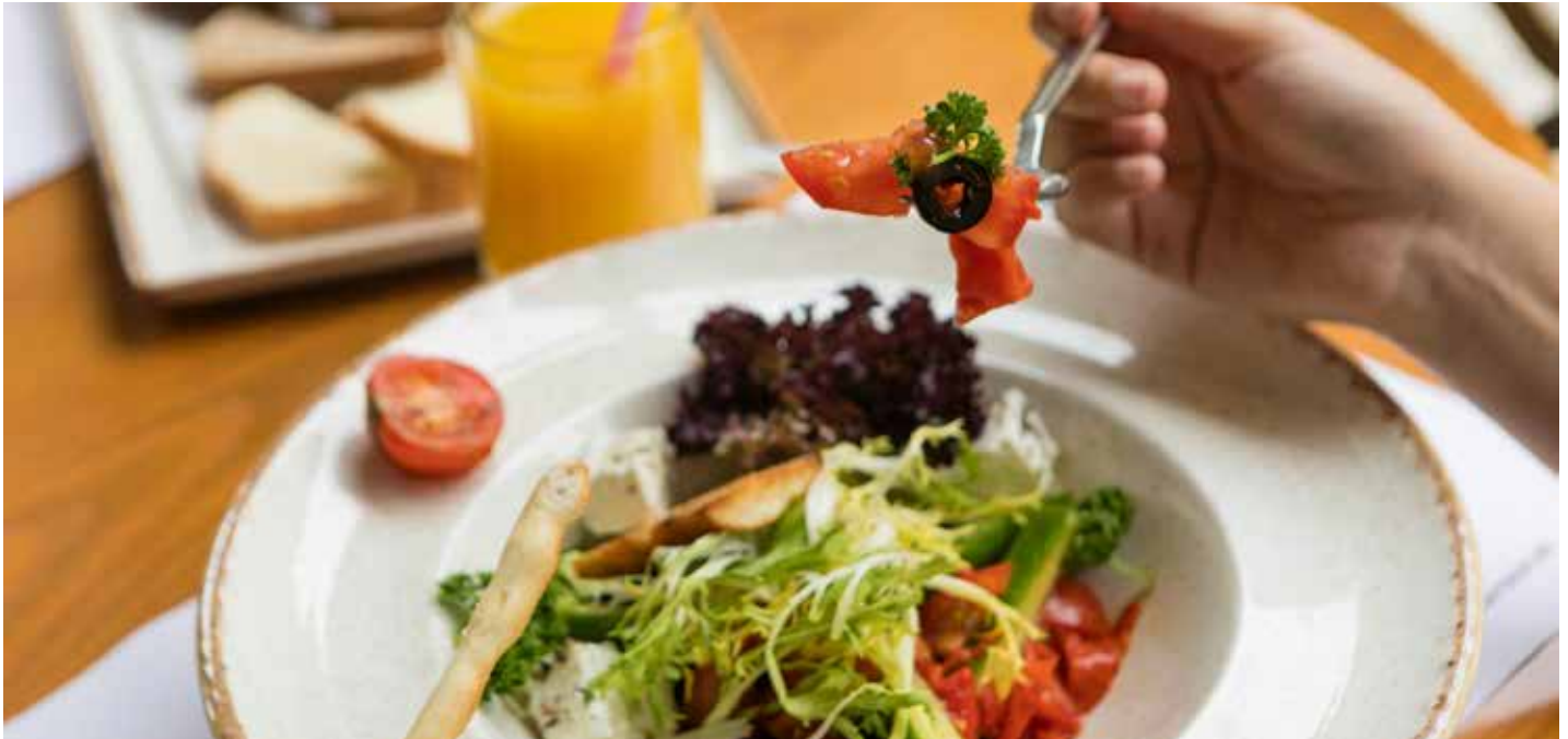
BASISCHE LEBENSMITTEL – GEMÜSE, OBST UND KRÄUTER BEGLEITEN DAS BASISFASTEN

Was eine Woche Basenfasten mit mir macht