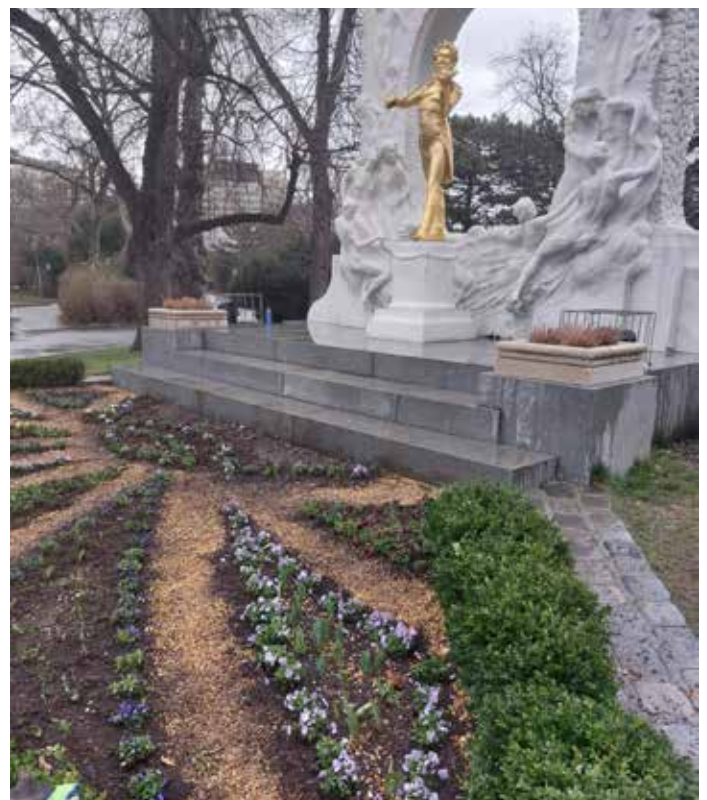
DER JOHANN STRAUSS MUSS IMMER PIKOBELLO SEIN

Wenn alles zu sprießen und blühen beginnt, heißt es Hecken schneiden, Rosen zurückschneiden und Rasen mähen. Nach Ostern werden dann die Tulpen und Märzenbecher durch Sommerblumen ersetzt. Dabei werden die Blumen nach Anordnung des Fachgärtners immer nach einem bestimmten Farbmuster eingepflanzt. Bei der Auswahl der Blumenfarben dürfen auch die jeweiligen Bezirksvorsteher mitbestimmen. Für eine besonders farbenprächtige Attraktion sorgt im Stadtpark jedes Frühjahr der Magnolienbaum. Der Mai ist für uns Stresszeit, da werden dann auch zusätzliche Saisonarbeiter:innen gebraucht, damit Wien auch in Zukunft die lebenswerteste Stadt der Welt bleibt, wie Bürgermeister Dr. Michael Ludwig häufig betont.